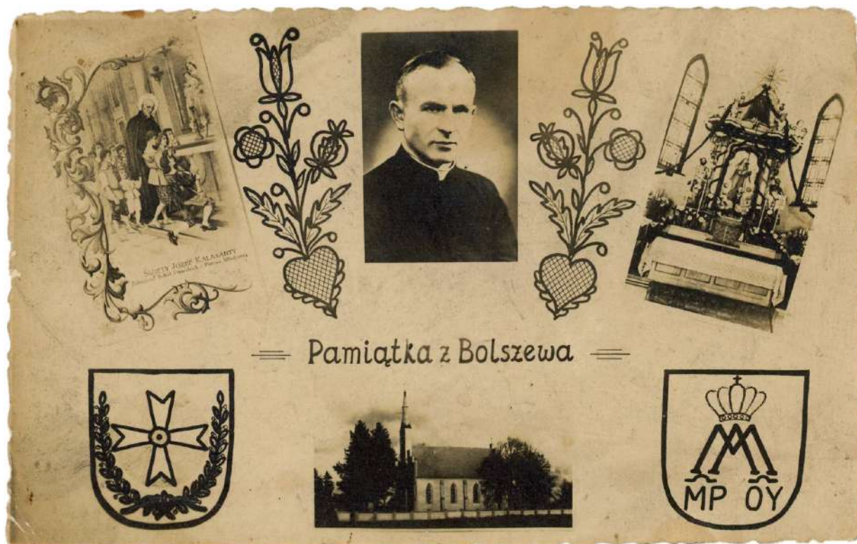
6. Pocztaówka wydana z okazji erygowania parafii w Bolszewie, 1 kwietnia 1950 r.