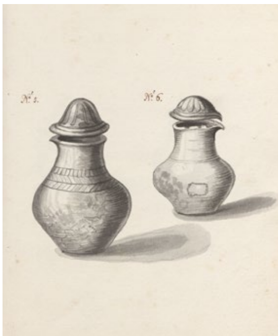
6. Rysunek urn z grobu odkrytego na Górze Gradowej w 1656 r.