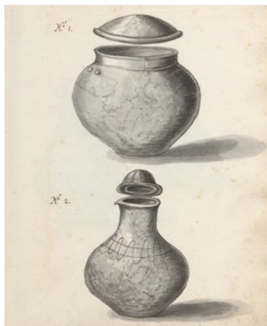
4. Rysunek urn z grobu odkrytego na Górze Gradowej w 1656 r.

Przełomowe znaczenie publikacji Reuscha nakazuje zadać pytanie o źródła jego wiedzy na temat odkrycia z Gdańska. Ilustracje znalezisk stały się bowiem od XVII w. podstawą