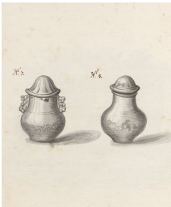
7. Rysunek urn z grobu odkrytego na Górze Gradowej w 1656 r.