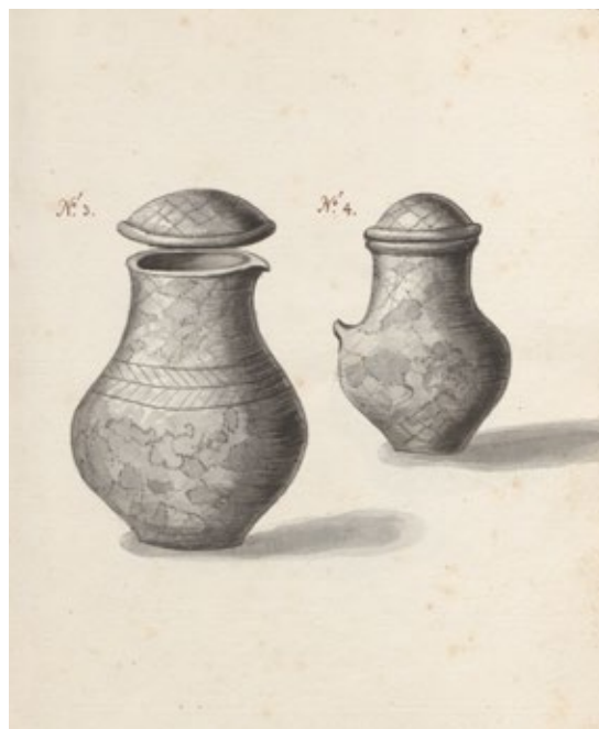
5. Rysunek urn z grobu odkrytego na Górze Gradowej w 1656 r.

Wolumin zatytułowany „Miscellanea Gedanensia” należał pierwotnie do patrycjuszowskiej rodziny Rennerów 37 . Zawiera odpisy aktów prawnych i korespondencji dotyczącej szczególnie stosunków polityczno-prawnych Głównego Miasta Gdańska ze Starym Miastem i przedmieściami z okresu od drugiej połowy XV do XVIII w. Nieprzypadkowo zatem znalazły się w nim