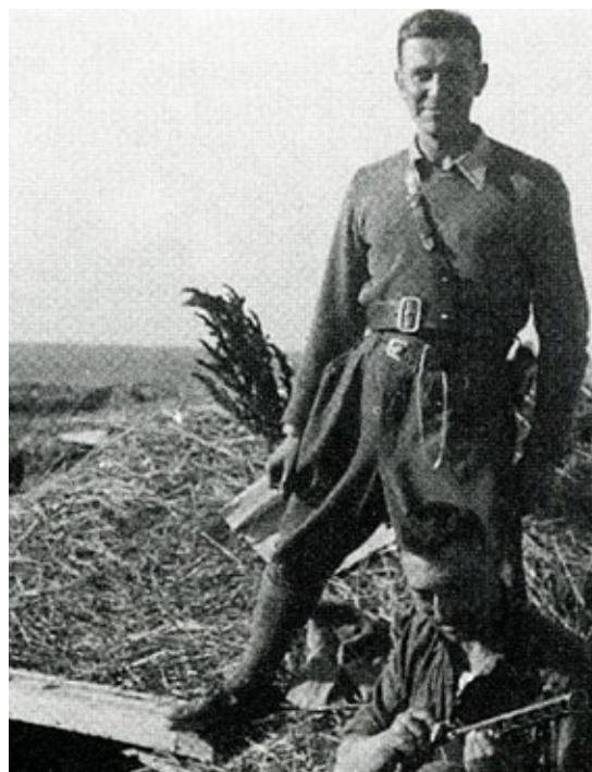
5. Na stanowisku polowym w rosyjskim stepie nad Donem, jesień 1943 r.

Pewnego dnia zaczęła krążyć plotka, że można zmienić swoje dotychczasowe położenie i zostać pracownikiem cywilnym, kontraktowym. Trzeba było tylko podpisać akt przysięgi. Przyszli do mnie niektórzy ze współwięźniów, aby porozmawiać o swoich rozterkach i woli – lub jej braku – aby dołączyć do organizacji, która zakładała ścisłą współpracę z Niemcami. Odpowiedziałem im, że na pewno poprawię swoją pozycję i warunki życia. „Ale co ty zrobisz?” – zapytali mnie. „Widzicie – odpowiedziałem – ja wychodzę z innej pozycji i muszę zachować przysięgę, którą składałem, odbierając nominację na oficera. Jednakże wszyscy muszą zachowywać się tak, jak dyktują im ich przekonania i sumienie”. Niedługo po tej rozmowie na dziedzińcu Niemcy ustawili długie stoły, gdzie zgodnie z ich założeniami Włosi mieli podchodzić, aby podpisywać i składać przysięgę. Tysiące mężczyzn stanęło w szeregach, a przed nimi przedstawiciele władz, oprócz Niemców