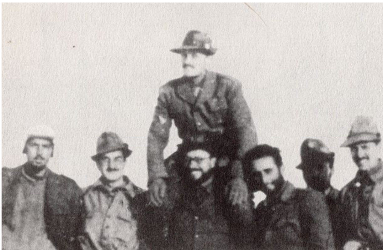
2. Oficerowie 255. kompanii z Batalionu „Val Chiese”, 1942 r. Autor wspomnień stoi pierwszy z prawej